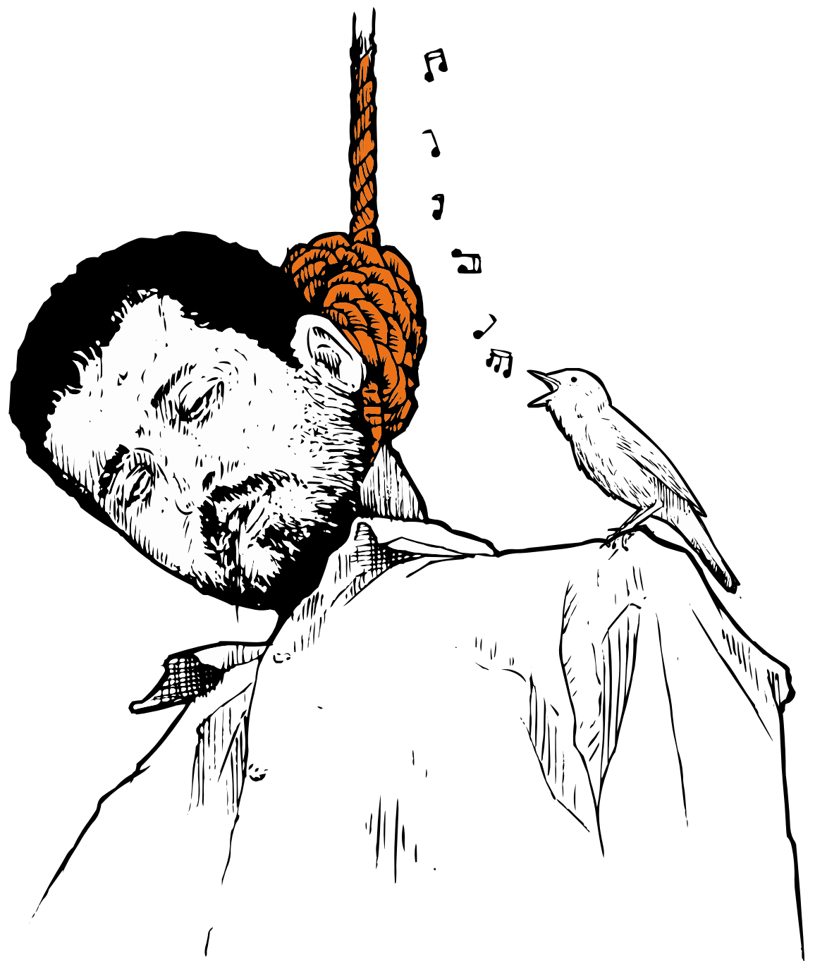
Beeld: Han Hoogerbrugge

Efrat Zehavi & Florimond Wassenaar de redactie