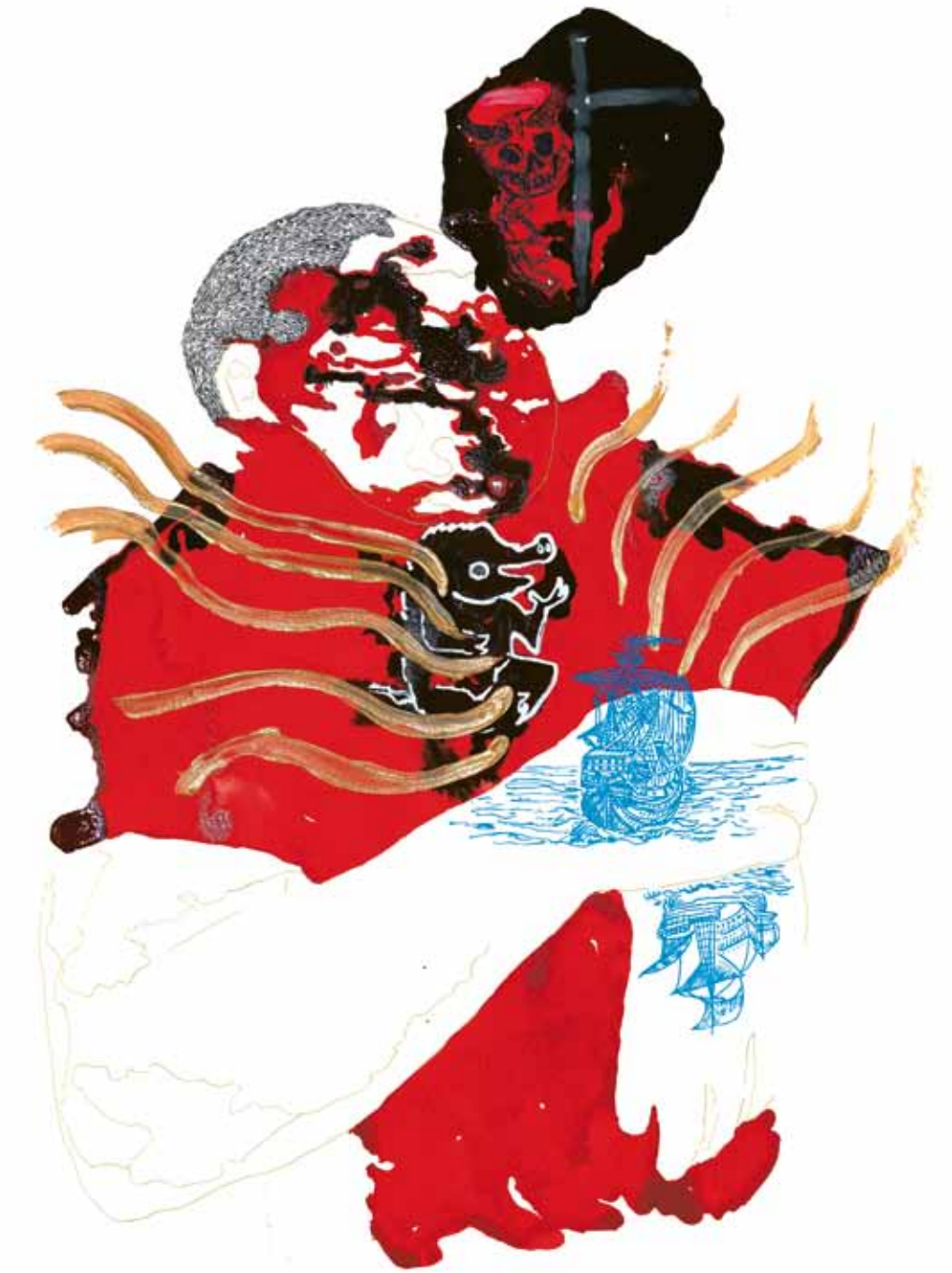
Beeld: Justin Wijers Sailing to new opportunities (2012) Gemengde media op papier (65x50,5 cm)

in de vreemdeling vrezen wij het meest van ons, onszelf in het beest is elk kwaad niet meer dan een misverstand