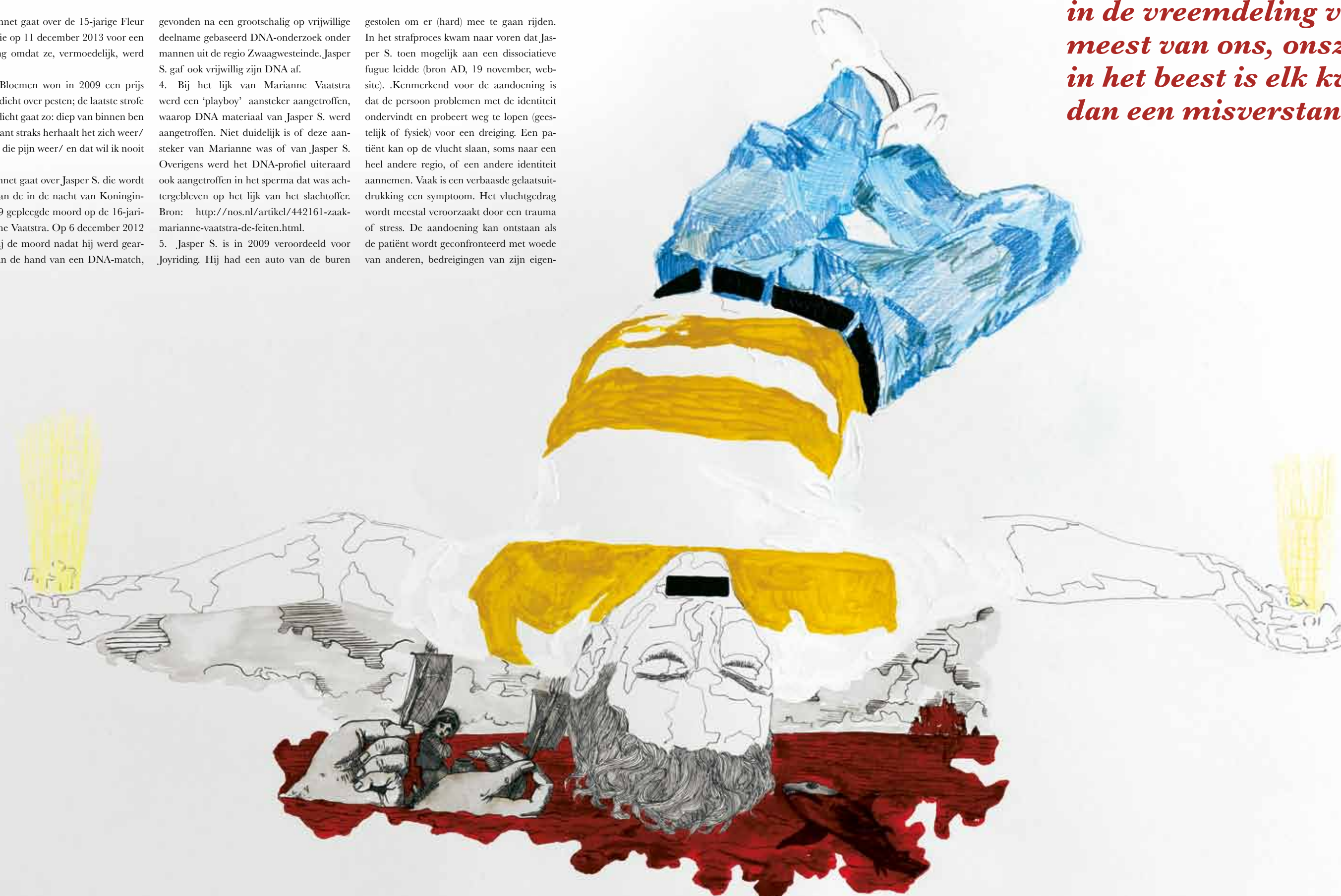
Beeld: Justin Wijers Twitter gave me false hope (2011) Gemengde media op papier (100x140 cm)