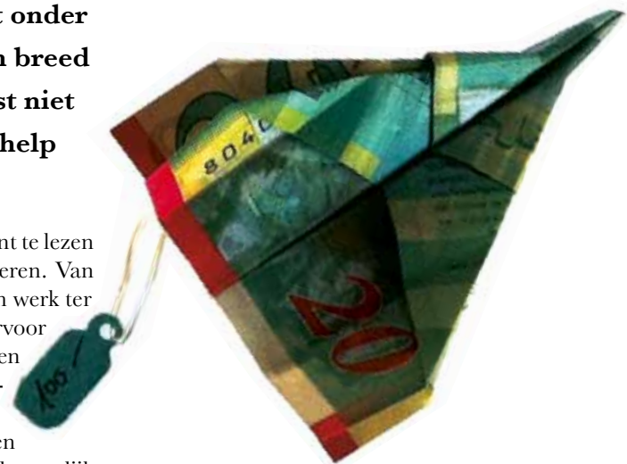
Beeld: Itamar Burstein Plain Paper, 2012, gevouwen papiergeld (Israëliische Shekels)

Dat kan in de eerste plaats door de krant te lezen en onder de aandacht te brengen bij anderen. Van kunstenaars en dichters vragen wij om hun werk ter beschikking te stellen aan ons. In ruil daarvoor vragen wij van de lezer ook dat te steunen door financieel bij te dragen aan de verspreiding en publicatie van de krant. Zo zijn wij in staat om het werk van dichters en kunstenaars onder de aandacht van zo veel mogelijk mensen te brengen. Tenslotte kunt u, als u dat wilt aan ons een donatie geven of een sponsor worden van de Dichtkunstkrant . Sponsors zullen worden vermeld op de volgende editie en op onze website. Neem voor donaties en sponsorschap contact met ons op via dichtkunstkrant@gmail.com . Wij horen graag van u.