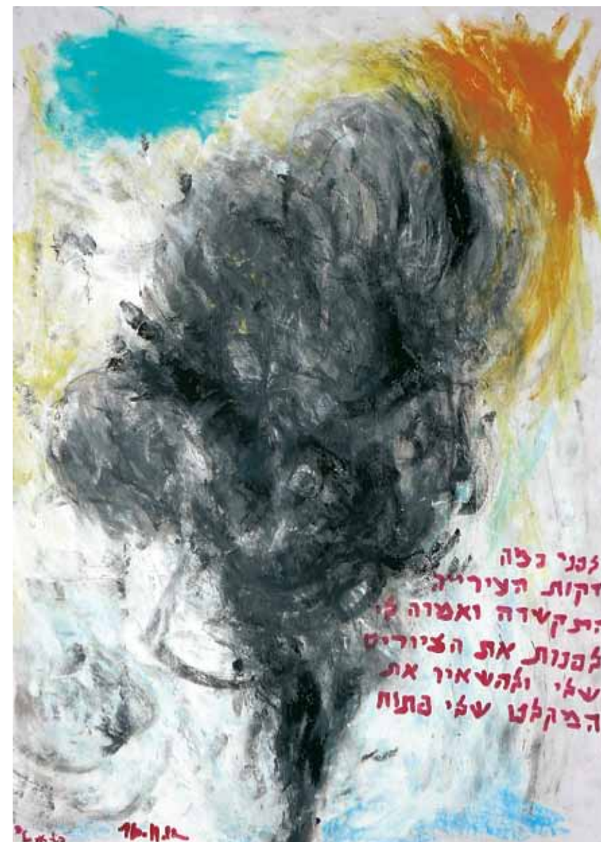
Beeld: Peter J. Maltz, "Pillar of smoke," gemengde media, 50cm x 70cm

Meromi. Hij maakte toen een groot totem(falisch)-achtig beeld. Deze totem werd uiteindelijk een iconisch beeld van de hedendaagse kunst van het begin van deze eeuw in Israël. Het beeld van Meromi is een soort uitvergrotting van een traditioneel Afrikaans beeld. Tegelijk refereert het ook aan de jonge Afrikanen die hun toevlucht zoeken als vluchteling of arbeidsmigrant in Israël. Toen Maltz werkte aan het beeld samen met Meromi, luisterden zij op 11 september 2001 naar de radio en hoorden het nieuws over de aanslagen o.a. op de Twin Towers in New York.