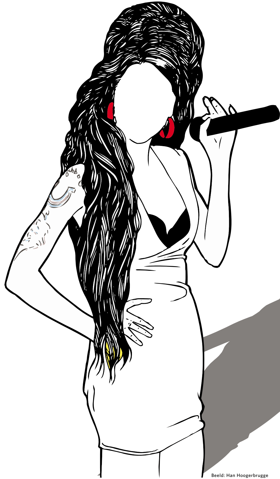
Beeld: Han Hoogerbrugge

Op zaterdag 23 juli 2011 overleed de Britse Jazz en Soulzangeres Amy Winehouse. De toen 27-jarige Winehouse werd door haar lijfwacht dood aangetroffen in de slaapkamer van haar appartement in Noord-Londen. De autopsie die op 25 juli 2011 op haar lichaam werd verricht, wees op dat moment geen duidelijke doodsoor-