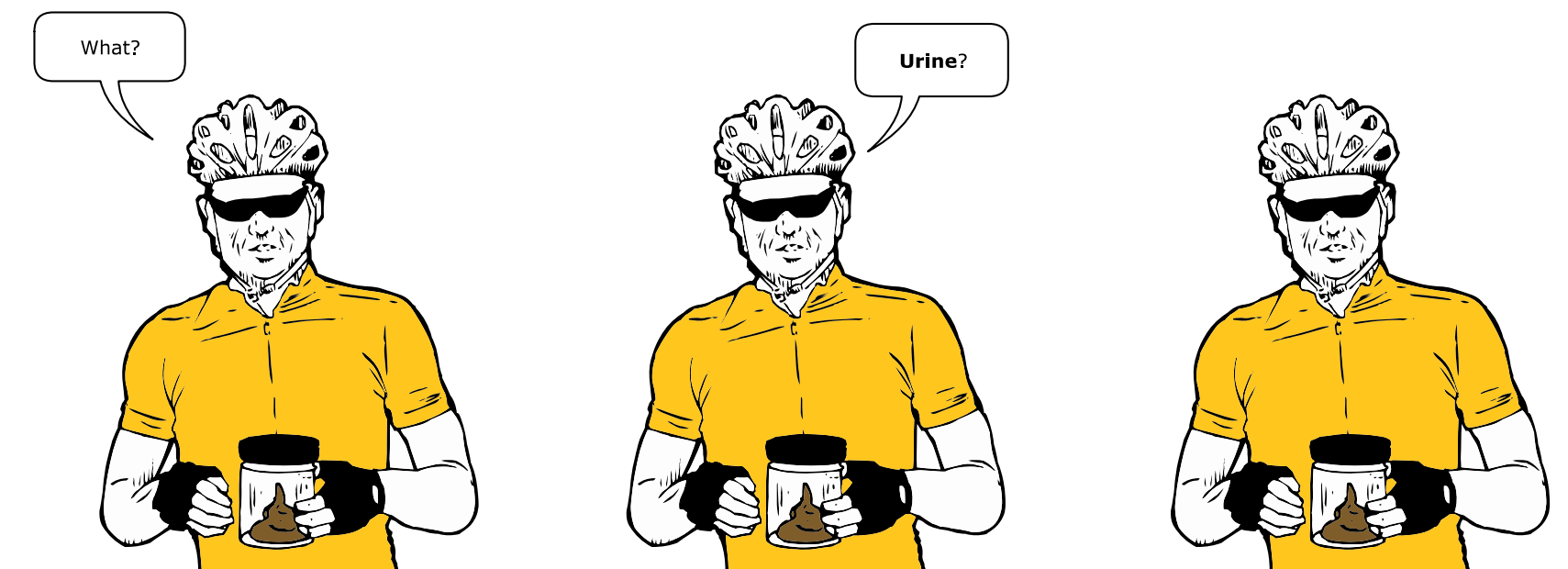
Did Everything To Avoid A Doping Test

dat het geen goede dag als je gaandeweg tureluurs van de bloedtransfusies, de spuiten in blikjes frisdrank en de modder die je maar om de oren. allemaal broodjeeperverhalen, leugens lopen snel, weet je wel. je omringt je hoofd met zand, toont janneke en klein mieke hoe breedgeschouderd je in feite bent.