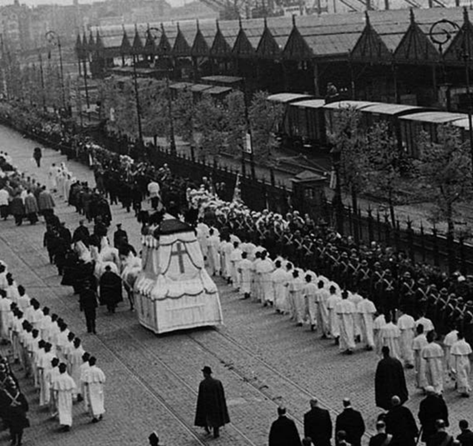
941#17: Overbrenging van het stoffelijk overschot van Pater Damiaan, 3 mei 1936, schenker Armand Steenackers