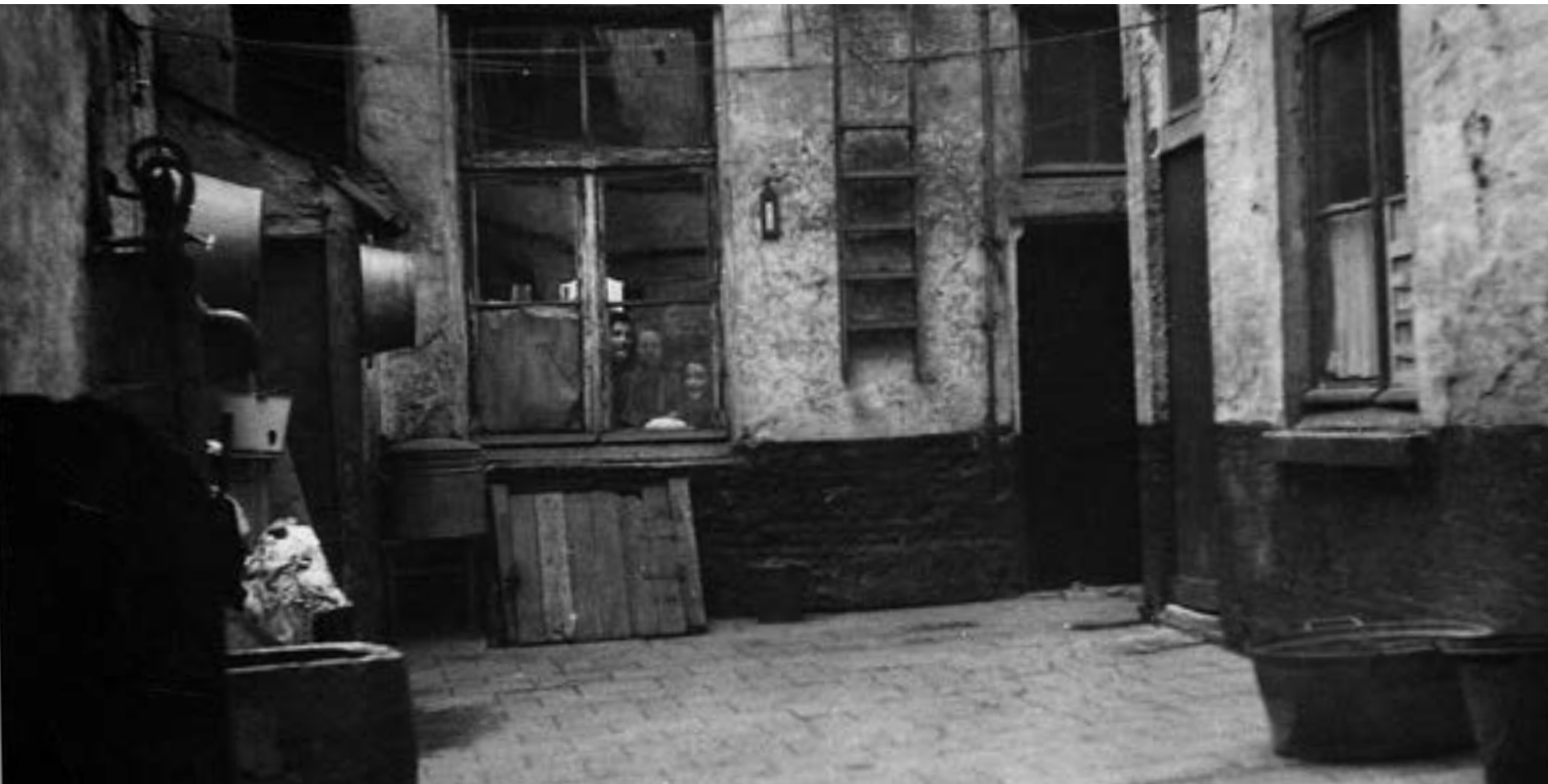
1065#8: Steeg Schoytestraat ca 1935