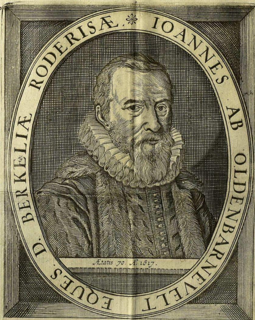
Jan van Oldenbarnevelt, Ridder, Heer van Berkel Rodenrys. &c. Advocaet en Bewaerder van't groot Zegel en Archiven van Holland en Westvriesland.

REINIER PAUW, Burger-meeſter van Amſterdam.