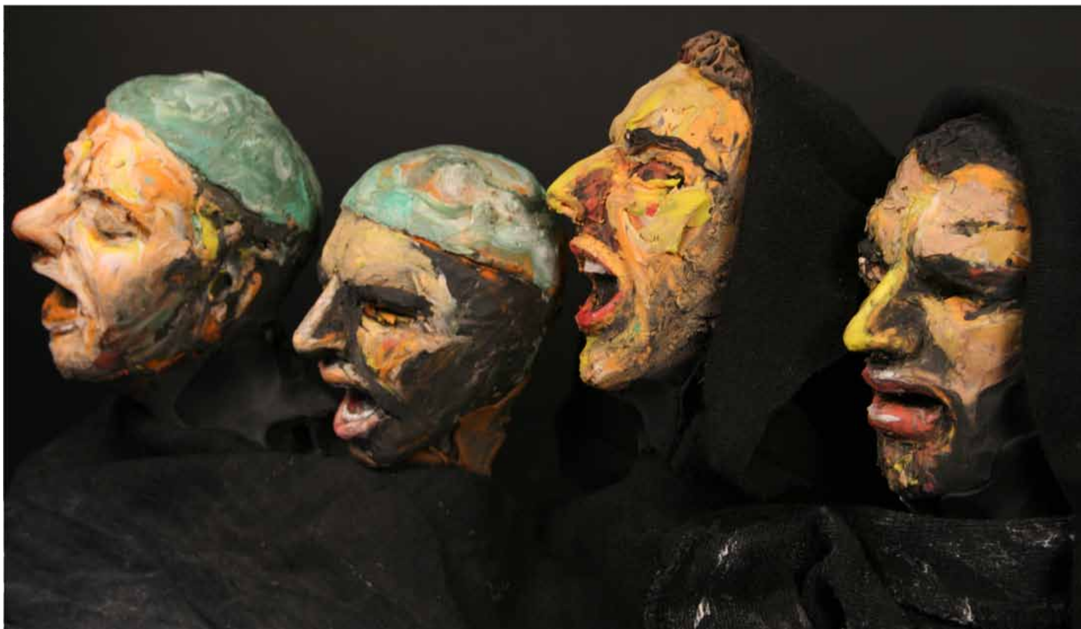
Oorlog om het Huis van de Vrede, Hebron, 4 december 2010