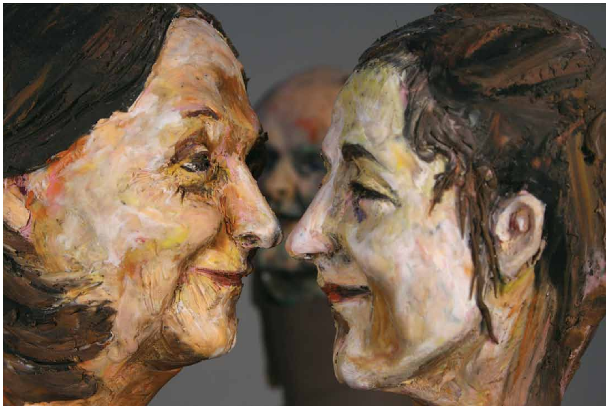
3 juli 2008 Yolanda Palecio, Ingrid Betancourt kort na haar bevrijding en haar moeder

dood ziet hij er uit als een overreden poesje 2 het overhemd van de vrijgekochte is louche 3 het gouden pistool 4 scheelde nog aan het beeld van een verkeerd gecaste tweederangs penoze