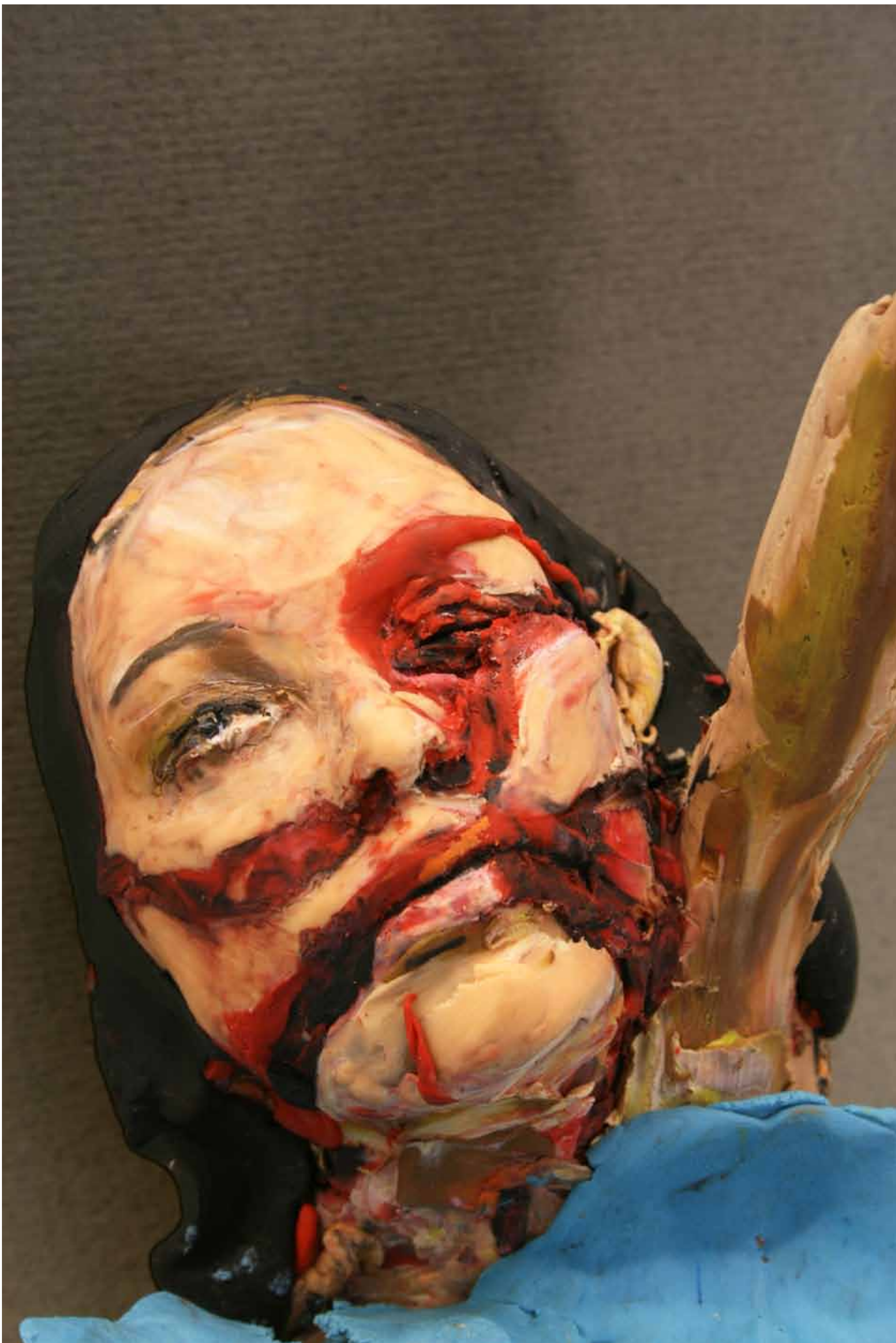
Neda Agha Soltan, Theheran, 20 juni 2009