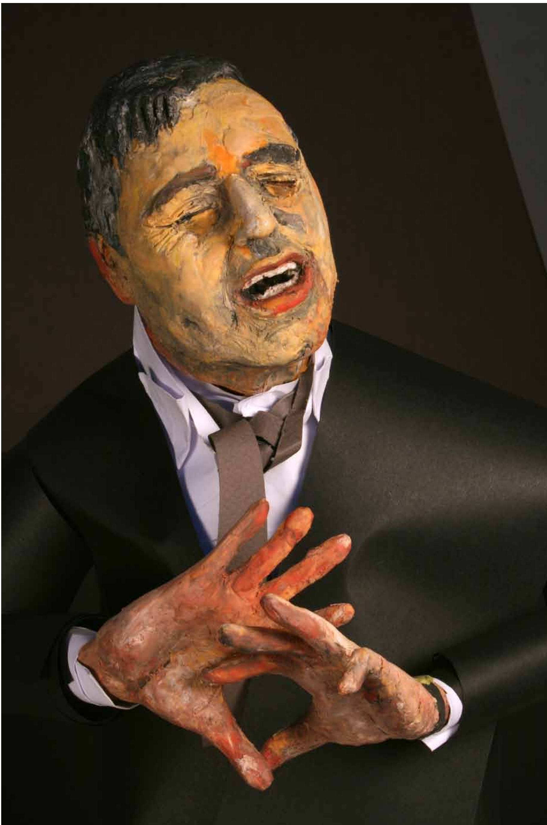
'Brown wint krediet met leiderschap in crisis', 19 oktober 2008