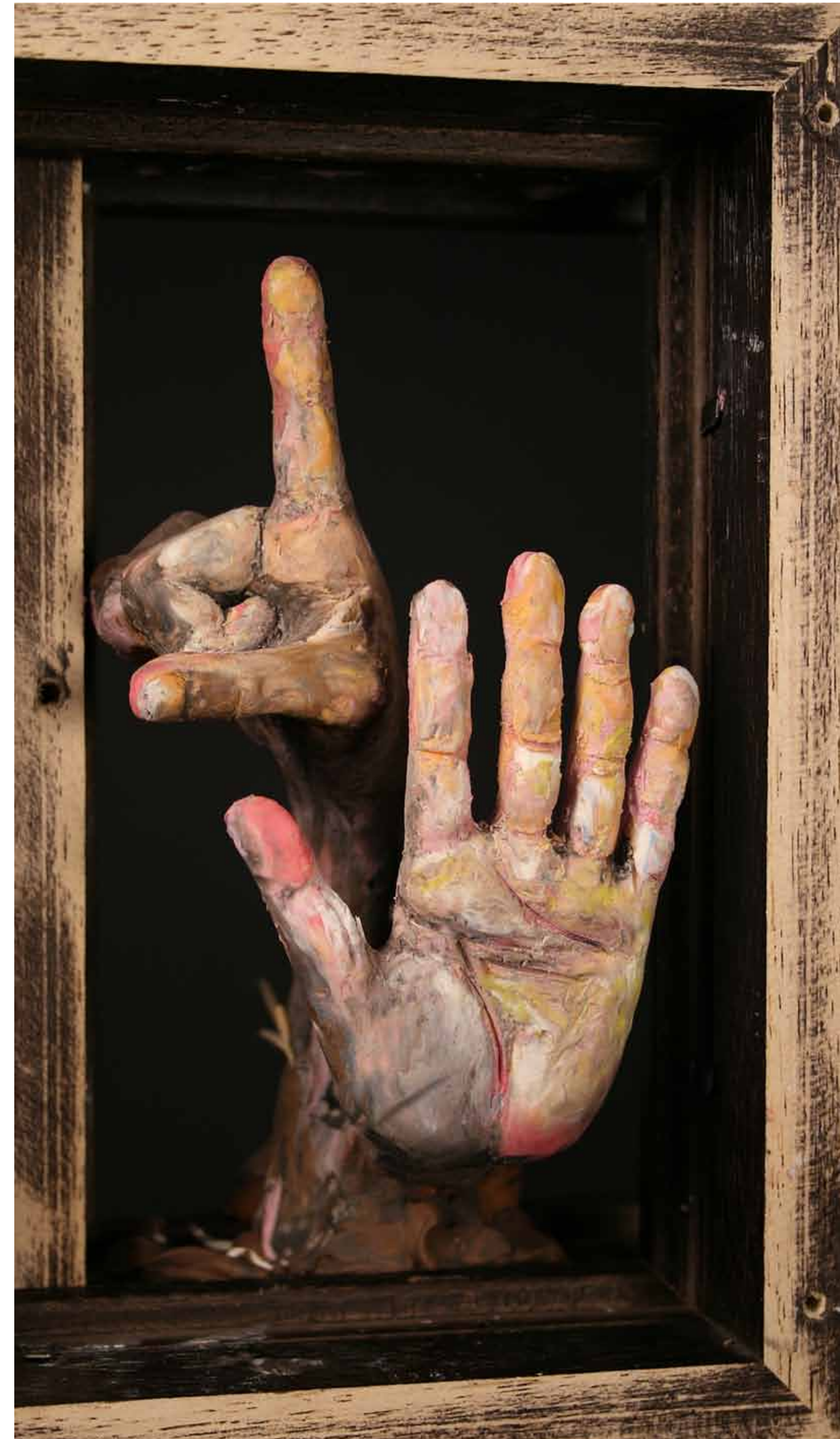
Gevangen op Guantánamo Bay, 16 mei 2009

zijn hand breekbaar als bladerdeeg craquelé brak bijna af toen hij de premier een hand gaf zijn huid droog als perkament van een dode zeerol zal door het flitsen van de camera’s ras verkleuren 6 we klikken klinisch aan want symboliek eist zijn tol het leven hem teruggegeven zal snel verbeuren immers het is niet meer van hem; het is van ons