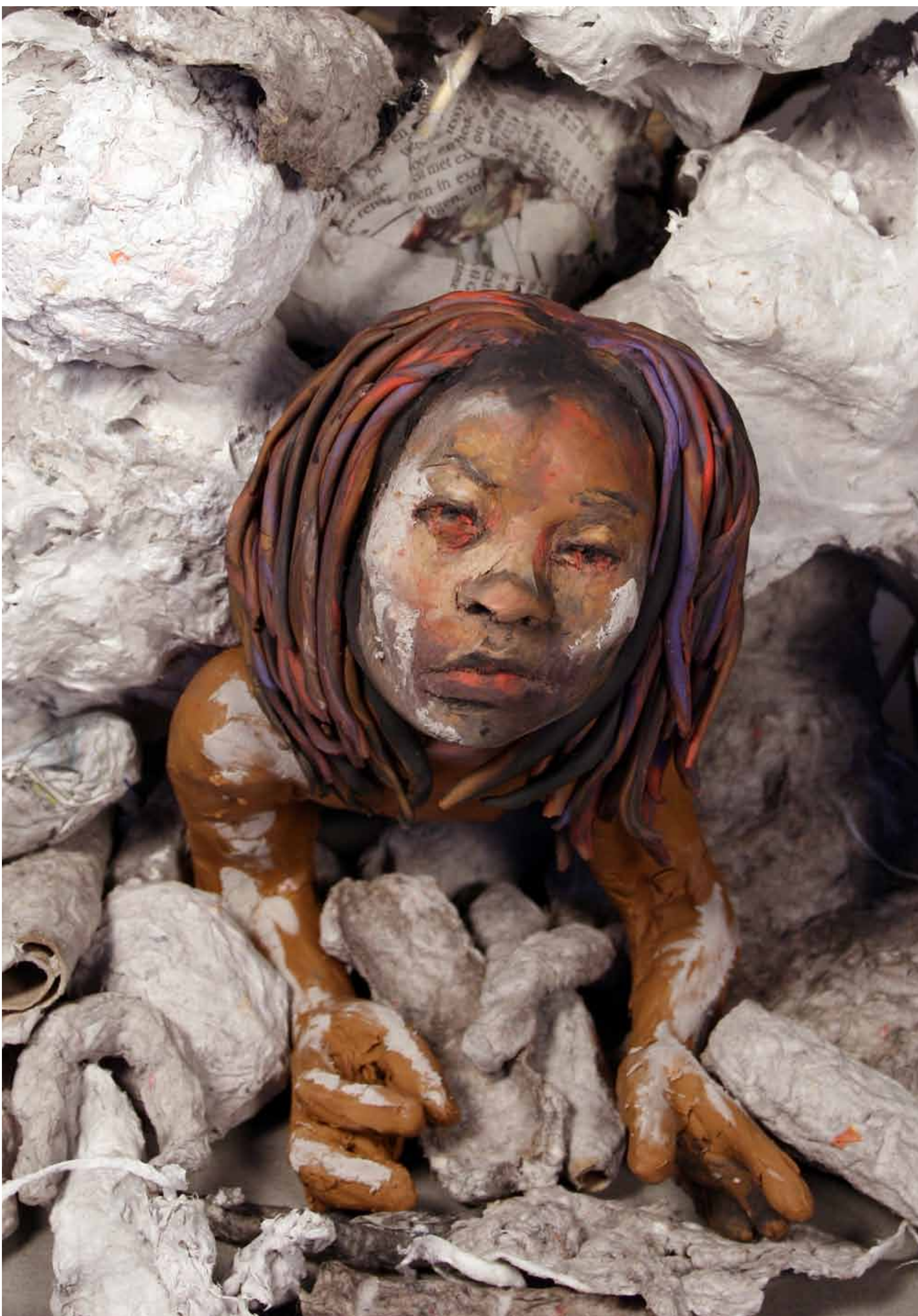
Aardbeving Haïti, 12 januari 2010